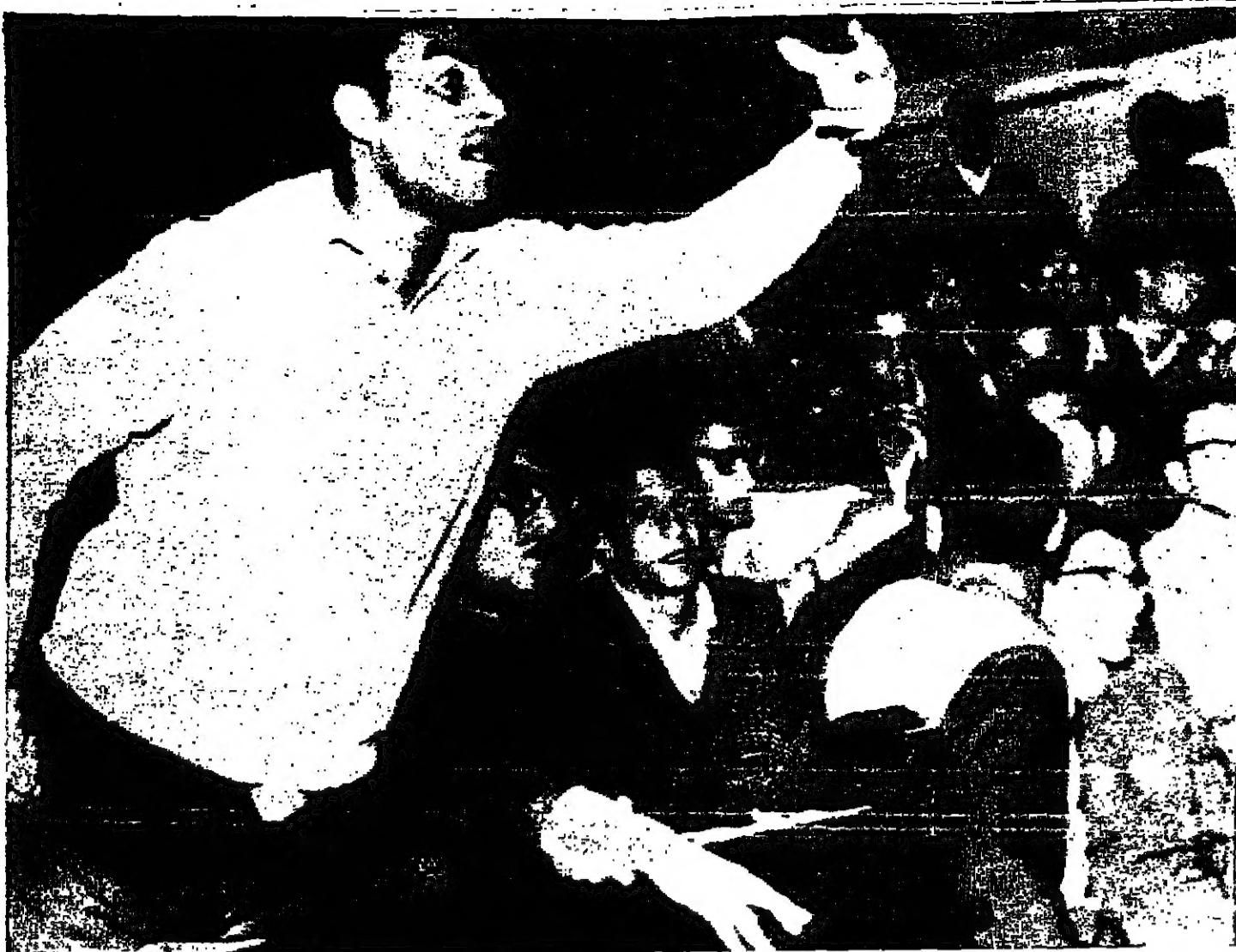
أحد زعماء الطلبة في الجمهورية العربية المتحدة يتحدث خلال اجتماع استغرق ست ساعات يوم الثلاثاء الماضي عند في مجلس الأمة وحضره السيد أنور السادات رئيس المجلس والسيد سيب شقر وزير التعليم العالي والسيد شعراوي جعما وزير الداخلية وتناول البحث فيه موضوع مظاهرات الطلبة ( تصوير الفوتوغرافير )